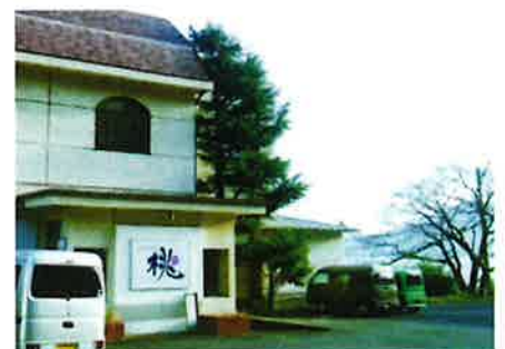
ドライブイン桃建物外観

※当日は参加者名簿と交流会席次をご準備しますので、積極的な交流の場としてください。