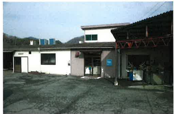
(有)トップ建物外観

金融機関を始めとする数々の方々のおかげにより、復活の兆しが見えた矢先に、西日本豪雨災害で会社が水没。多大なる損害を受けたが、取引先からの支援や商工会と伴走することで、訪れた 2 度の危機を乗り越え、事業継続している事業所である。