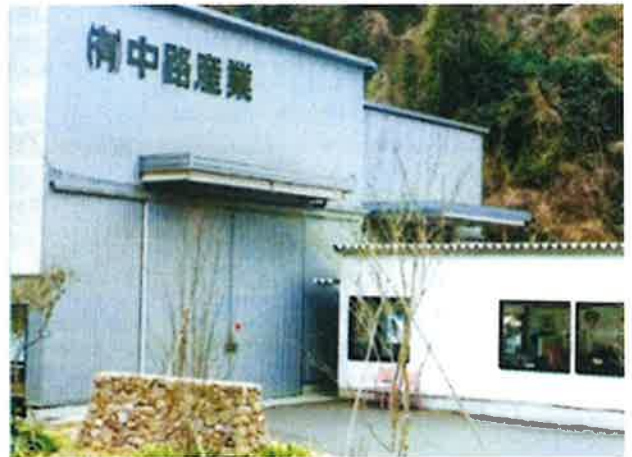
(有)中路産業建物外観

商工会とは、記帳代行、日本政策金融公庫の融資、補助金申請、経営革新計画作成など多岐にわたり、伴走してきた事業所である。近年の受注増や従業員の働き方改革に対応するため、新工場の建設や休憩所の設置を実施した。